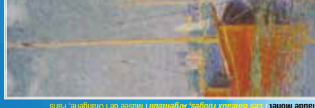
Claude Monet | Les Bateaux rouges, Argenteuil | Musée de l'Orangerie, Paris