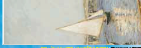
Gustave Caillebotte | Voiliers à Argenteuil | Musée d'Orsay, Paris