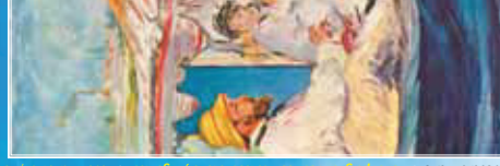
Edouard Manet | Baigneur prenant son bain au bateau-à-vapeur | Argenteuil | Neue Pinakothek, Berlin