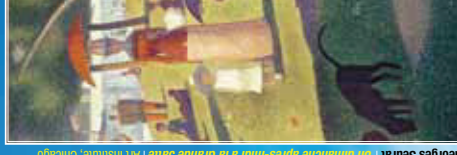
Georges Seurat | Un dimanche après-midi à la Grande Jatte | Art Institute, Chicago