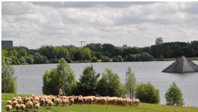
Expérimentation d'éco-pâturage sur la communauté d'agglomération de Cergy-Pontoise (en page 3 de la lettre du Réseau)

Le réseau regroupe douze territoires franciliens engagés dans une démarche de projet agriurbain. Plaine d'avenir 78 en est membre depuis février 2013 au titre de la Plaine de Montesson.