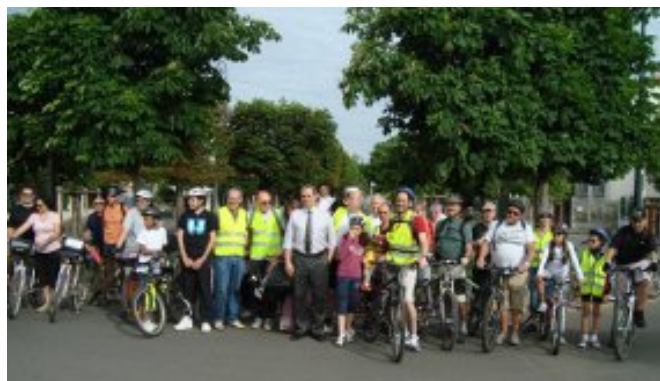
La sortie vélo 2011, avant le départ