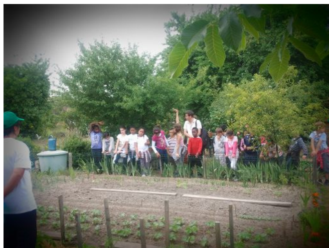
Fête de la nature 2011 dans les jardins de Natur'Ville