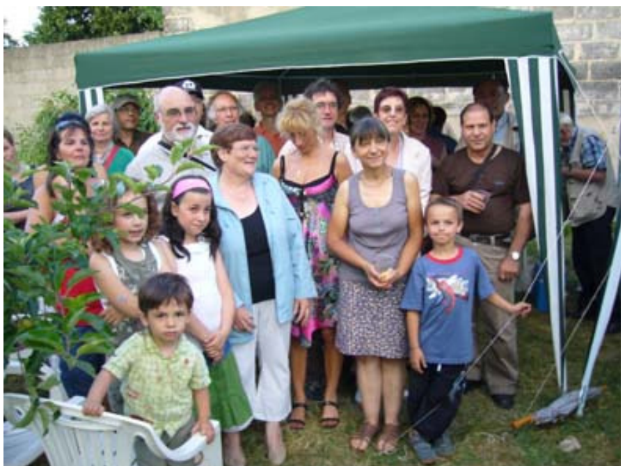
Les jardiniers et les sympathisants de Natur'Ville à Sartrouville