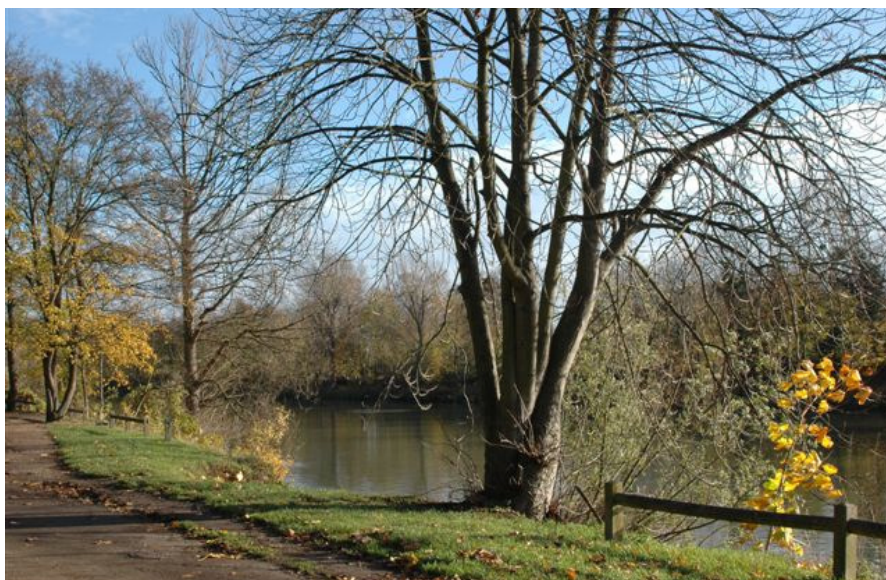
Les berges de Seine à Croissy: un patrimoine à protéger et valoriser

Contrairement à ses prédécesseurs, le nouveau syndicat se préoccupera aussi de l'entretien courant du fleuve, en y consacrant un budget annuel de 300 000 euros.