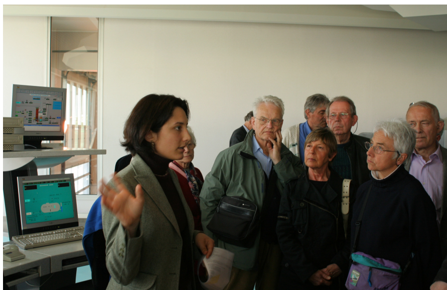
Semaine du développement durable 2006 : visite de la station d'épuration d'Achères

Forme 21, Association loi 1901 Président